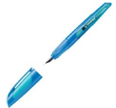
« EASY BUDDY » de Stabilo