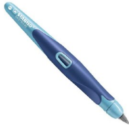
« EASY BIRDY » de Stabilo Droitier ou Gaucher