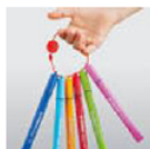
Feutres « Cappi » de Stabilo