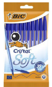
« Cristal soft » de BIC