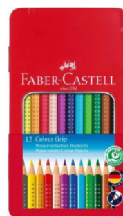
Crayon couleur « colour grip » de Faber-Castell